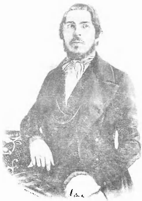
Ф. ЭНГЕЛЬС В СЕРЕДИНЕ 40-Х ГОДОВ,